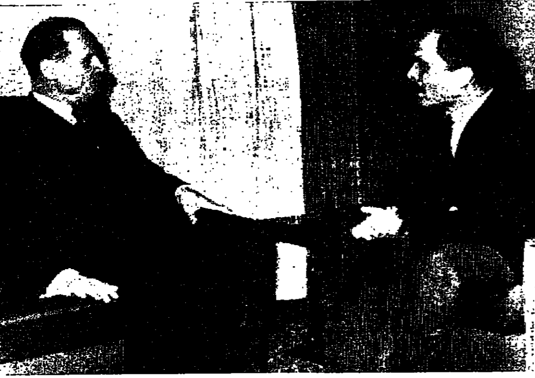
جلالة الملك المعظم يتحدث الى الدكتور غونار يارنغ بمبعوث الامم المتحدة الى الشرق الاوسط

اول موازنة اردنية لا تتضمن مساعدي اميركية وبريطانية عمان - قال السيد بهجت القلوني رئيس الوزراء ان موازنة الدولة لهذا العام ستقدم الى مجلس النواب يومان تقصير في وارداتها المساعدية الاميركية بل ستكون مستقلة الى المعادة القليلة على صفحة ٤ عمود ٤